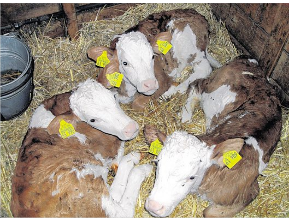
Drillinge im Kuhstall: Über diese Seltenheit darf sich die Landwirtschaftsfamilie Farchmin aus Diebrunn bei Wernberg-Köblitz freuen.

Neuenschwand. Die Asphaltierungsarbeiten auf der B 85 im Bereich östlich von Neuenschwand (Gemeinde Bodenwöhr) stehen kurz vor dem Abschluss. Soweit es die Witterungsverhältnisse zulassen, wird heute die Deckschicht bei der Einmündung der Kreisstraße SAD 16 (B 85 – Bodenwöhr) hergestellt. Aus diesem Grunde wird die Kreisstraße SAD 16 (Schwandorfer Straße) im Einmündungsbereich in die Bundesstraße 85 am Dienstag und Mittwoch für den Verkehr gesperrt. Die Umleitung erfolgt über die Staatsstraße 2398 (Hauptstraße). Die Verkehrsteilnehmer werden um Beachtung gebeten.